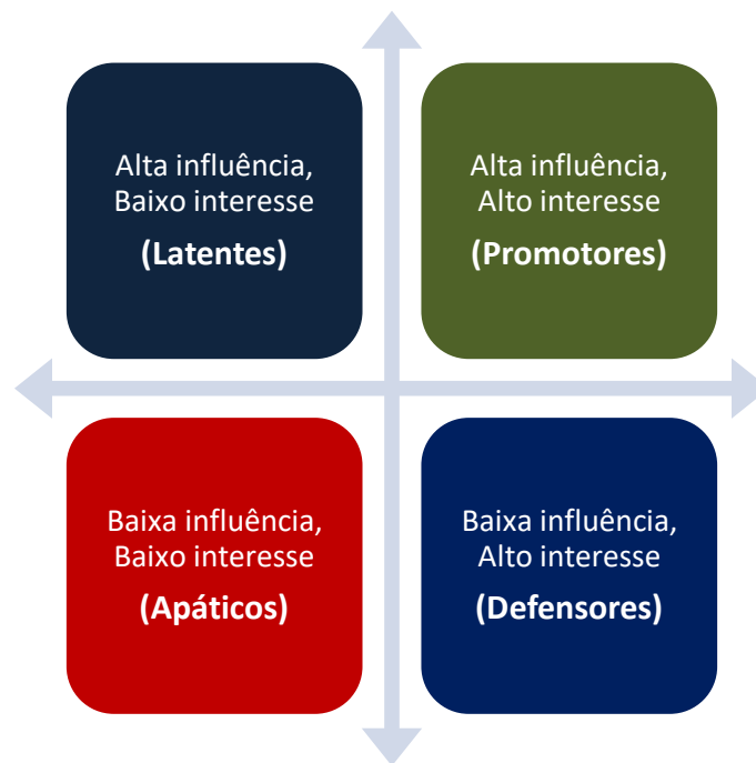
Figura 1. Diferentes tipos de stakeholders

A função do Gerente de Teste inclui a compilação de uma lista detalhada de stakeholders e a compreensão da conexão de cada uma delas com as atividades de teste, usando a matriz de stakeholders para aumentar a eficácia das práticas de gerenciamento de testes.