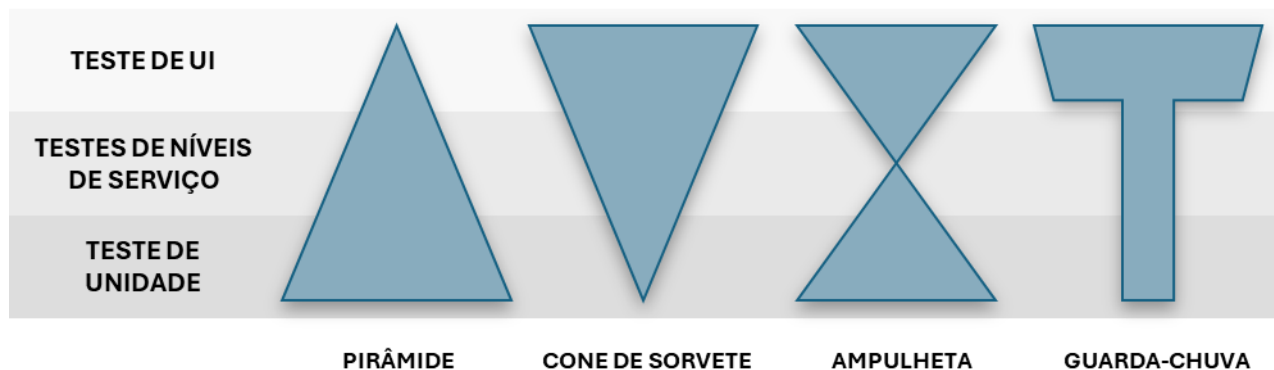
Figura 1: Exemplos de distribuições de teste

conjunto de automação de teste de interface do usuário, a redução do tempo de execução dos testes e o aumento da estabilidade.